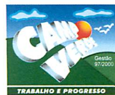
ONESCIMO PRATI PREFEITO MUNICIPAL

Gabinete do Prefeito Municipal de Campo Verde, em 25 de Setembro de 1997.